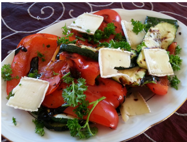
Grillowane warzywa włoskie z serem

Wartość energetyczna porcji: 60 kcal Napój ten zaspokoi głód i chęć spożycia czegoś słodkiego oraz dostarczy witamin przeciwutleniających.